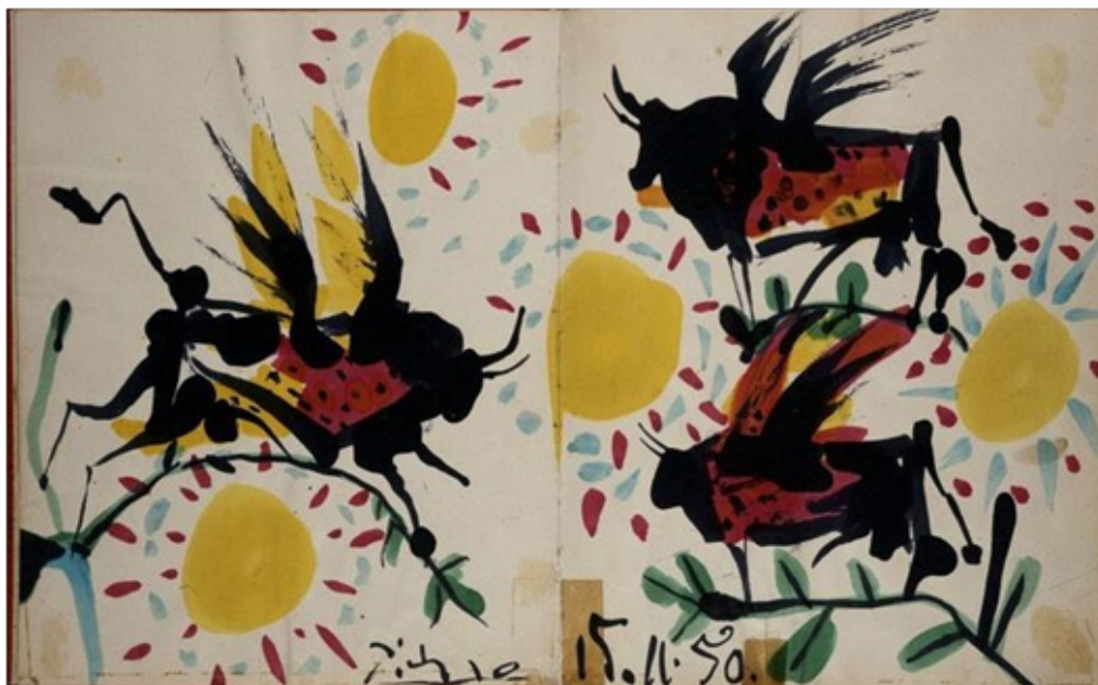
Páginas do Livro de Visita – original da pintura de Picasso