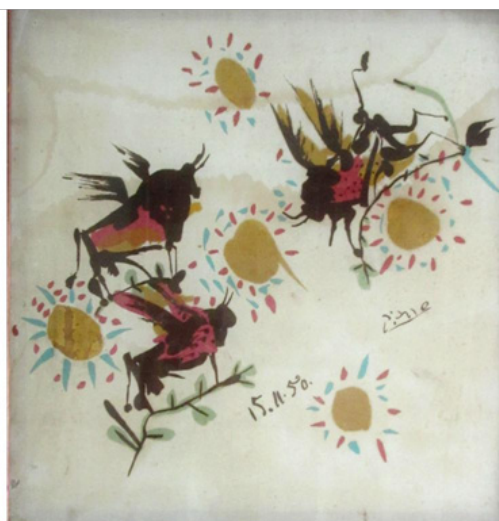
Tauromaquia serigrafia sobre seda 1950