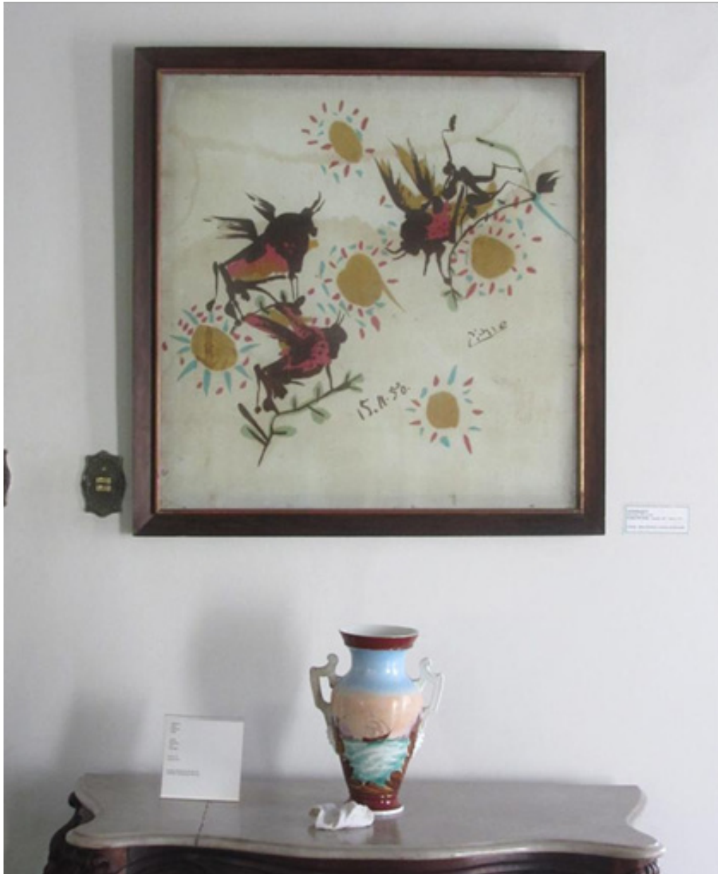
Tauromaquia serigrafia sobre seda 1950

A obra Tauromaquia faz parte da lista da doação feita por Assis Chateaubriand, sendo recolhida ao MASP durante a campanha em 1968 e enviada para São Luís do Maranhão em 1988. Nos documentos analisados no museu paulistano não foi encontrado nada a respeito da obra, se foi comprada ou recebida como doação por algum colaborador da campanha dos museus regionais. Chegou à capital maranhense em estado lastimável, conforme relatos da época, e teve que passar por restauração realizada pelo Museu Nacional de Belas Artes, fruto de um Termo de Cooperação Técnica de 20 de dezembro de 2005. O